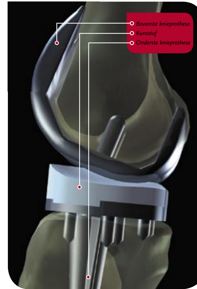
De knieprothese, zijaanzicht

onder begeleiding van de fysiotherapeut de revalidatie. Die bestaat vooral uit het buigen en strekken van de knie. In principe mag de knie direct volledig worden belast. Meestal kunt u na tien tot veertien dagen naar huis. In sommige gevallen vindt revalidatie plaats in een verzorgingshuis, verpleeghuis of revalidatie-instelling. Steeds wordt bekeken in hoeverre de functie van de knie zich herstelt. Soms is het nodig de knie onder narcose door te bewegen om de revalidatie te